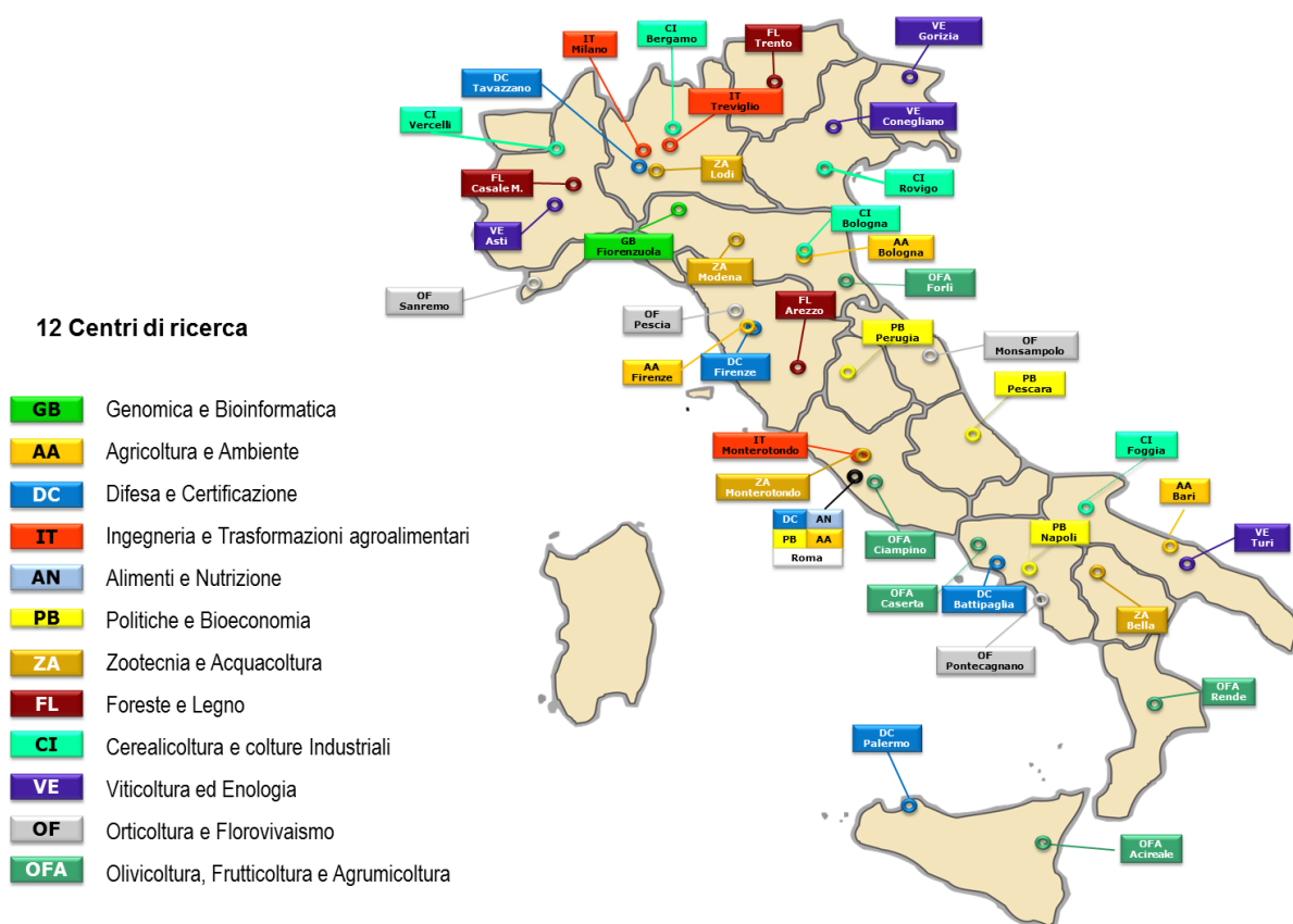
Figura 1: Dislocazione dei Centri di ricerca

La figura 1 illustra la dislocazione, sul territorio italiano, dei 12 Centri di ricerca.